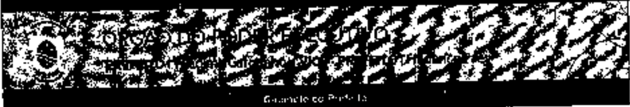
Grande do Paraíba

Volume 103 - Edição 100 2021 - 2021 Início 944 www.camposdosgoytazes.org.br