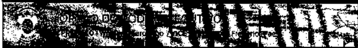
Gabinete do Prefeito

DECRETO Nº 443, DE 16 DE NOVENBRO DE 2021 - LER N.º 4429