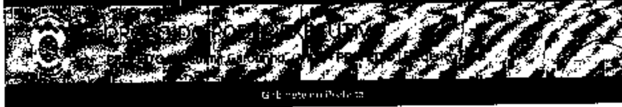
Gratuito em Destaque

DECRETO Nº 317, DE 14 DE OUTUBRO DE 2021 - S.E. 00424