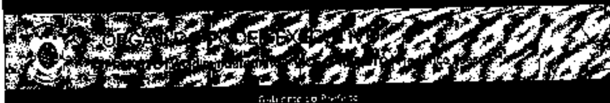
Realização do Prefeito

DECRETO Nº 217, DE 06 DE OUTUBRO DE 2021 - LEI Nº 2024