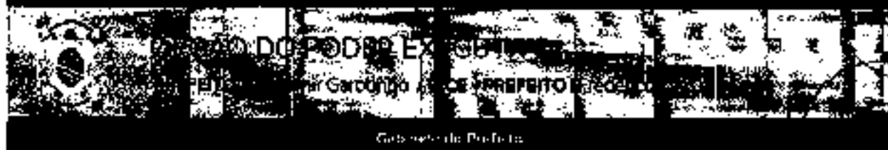
Garcilho de Freitas

DECRETO Nº 413, DE 11 DE NOVEMBRO DE 2021 - LEM 10060