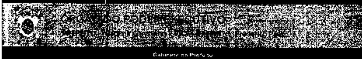
Gabinete do Prefeito

Telefone: (51) 3633-1111 E-mail: d.o@camposgoytazes.rs.gov.br Edição: 2021 www.camposgoytazes.rs.gov.br