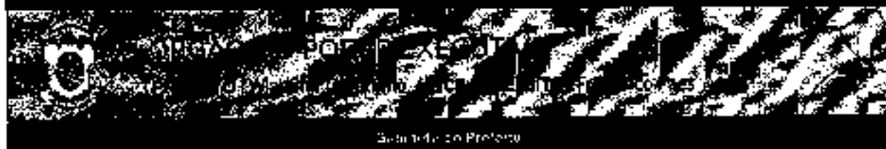
Sumário do Prefeito