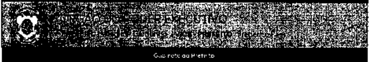
Quadro do Prefeito

Volume 10 - Nº 11 Data de Edição: 13/09/2021 Edição 930 www.campos.rj.gov.br