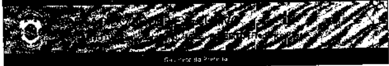
Gravado da Prefeitura

DECRETO Nº 434, DE 23 DE DEZEMBRO DE 2021 - URM 16.242