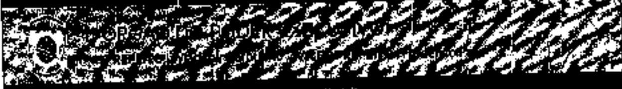
Gravado por Prefeitura