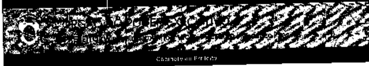
Carteira de Parcelas

Volume 10 - Edição 2527 Edição 949 www.camposdosgoytazes.rj.gov.br