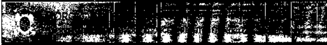
Gabinete do Prefeito