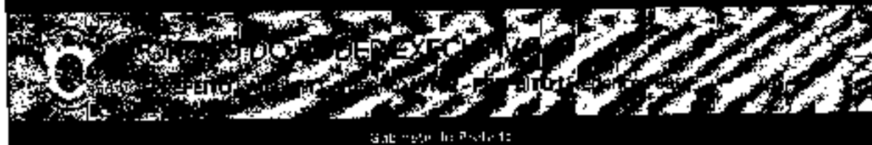
Sabino - In: Paulo de

2021, 12 de Dezembro de 2021 Nº 12.300-0324 SUPLEMENTO ON-LINE www.camposdosgoytazes.rj.gov.br