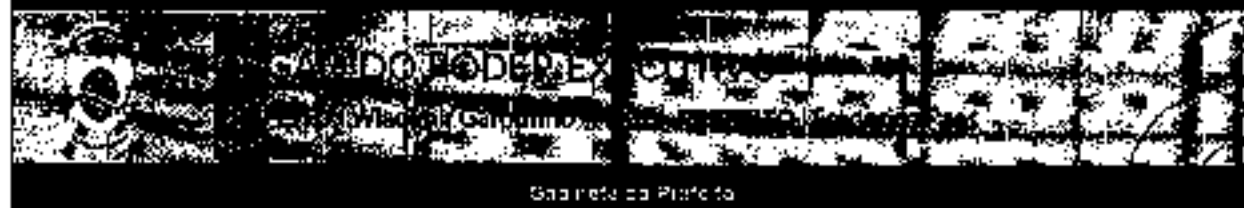
Gabinete da Prefeitura

DECRETO Nº 424, DE 19 DE NOVEMBRO DE 2021 - LEM N.º 21