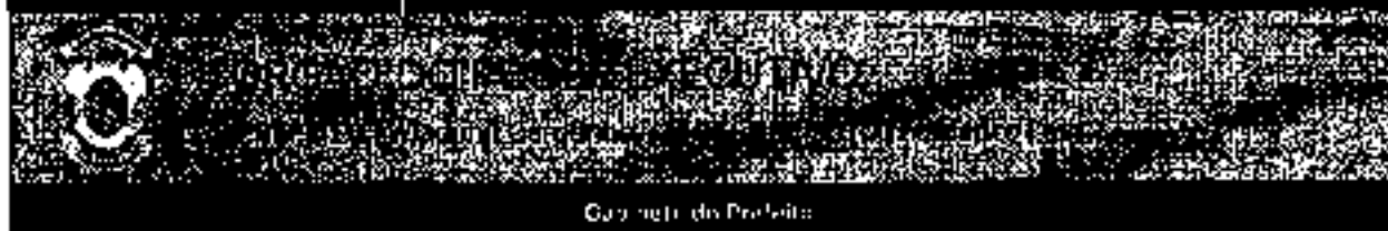
Capanga do Prefeito

Volume 10 - Número 10 Ano 10 - 2021 Edição 438 www.camposdosgoytazes.rn.gov.br