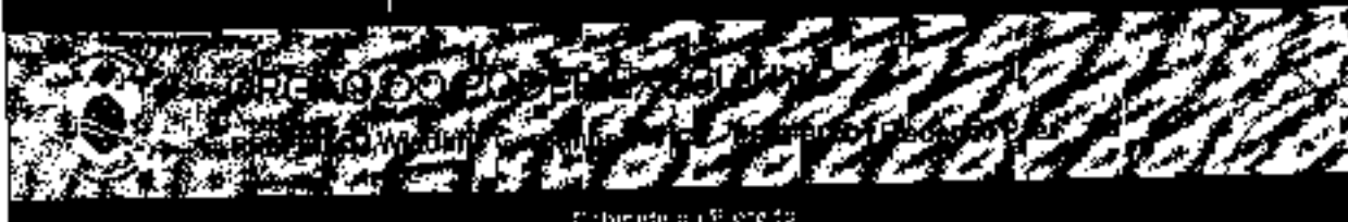
Construção de prédios

Campos dos Goytacazes, RJ, 2021 Edição 045 www.camposdosgoytazes.rj.gov.br