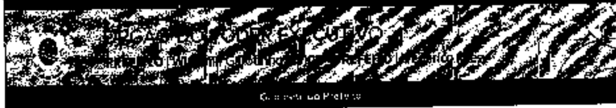
Colheita da Produção

Lei nº 9.888, de 20 de setembro de 2021.