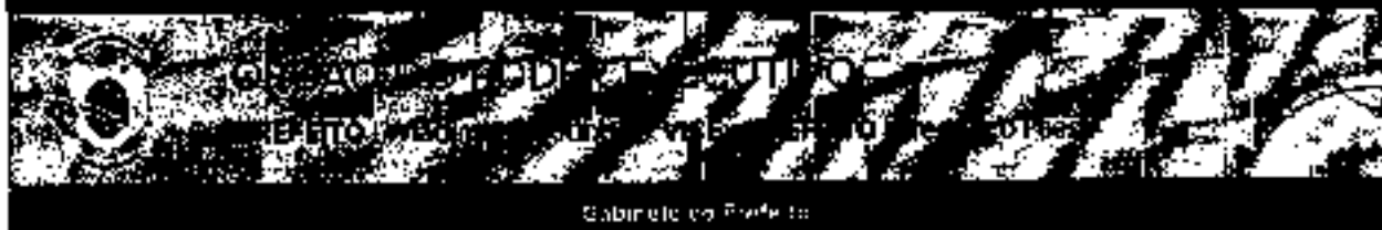
Gabinete do Prefeito

DECRETO Nº 263, DE 04 DE OUTUBRO DE 2021 - LID 13.283