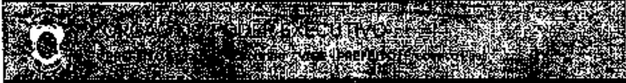
Gabinete do Prefeito