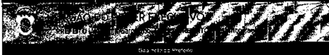
Gaia no Rio do Prefeito

DECRETO Nº 206, DE 27 DE OUTUBRO DE 2021 - LUI HUNG