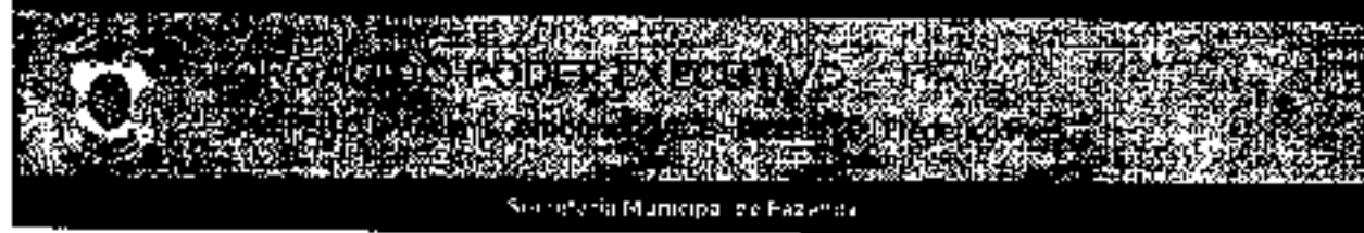
Sede da Prefeitura Municipal de Campos dos Goytacazes

Campos dos Goytacazes, RJ 21 de Março de 2021 Edição 877 www.campos.rj.gov.br