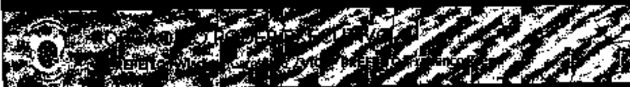
Colheita do Pão de Açúcar

Lei Complementar nº 25, de 17 de dezembro de 2021.